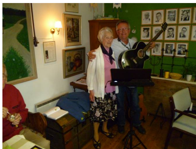
Underhållningen stod Kurt Dahl för