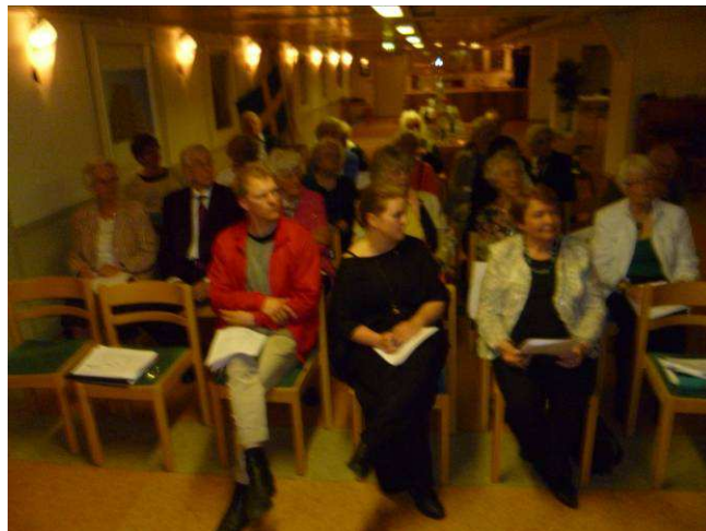
En liten men tapper församling