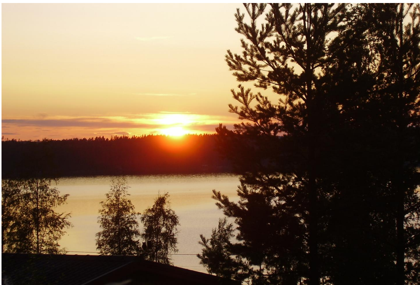
Solnedgång över Blysjön i Forshaga