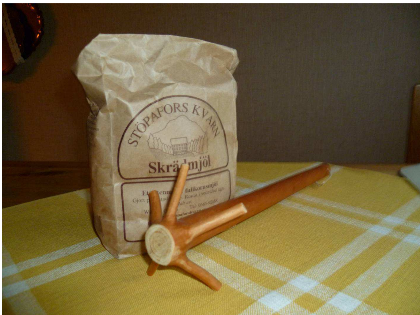
Mjöl och verktyg till nävgröt